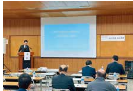
五木田講師講演の様子

金融業部会では今後も経済等に関するテーマで講演会を開催いたします。ぜひ参加ください。