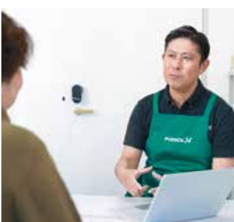
対面でお客様に不具合の原因をわかりやすく説明

特に購入してから3年以上経過している場合は、ちょっとしたメンテナンスで快適になることもあるので、早めの診断をおすすめします。パソコン周りのお困りごと解消は業務の効率化や生産性をあげる上での近道です。