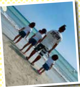
休日は家族でレジャーにでかけます