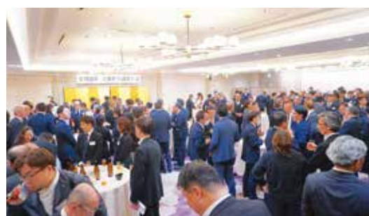
約250名の方々にご参加いただきました