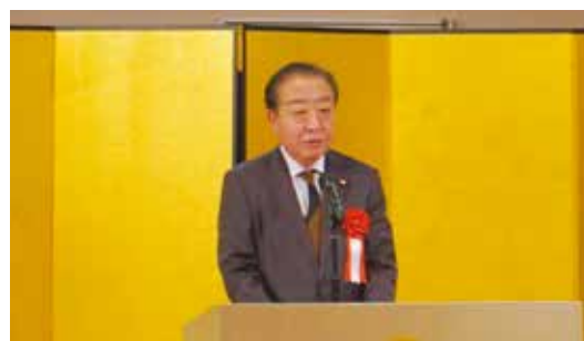
立憲民主党 野田佳彦代表のご祝辞