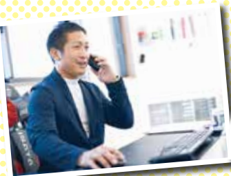
電話でのコミュニケーションも明るさ重視

職人の減少や高齢化もあり、施設や住宅の現状回復工事とクリーニングを一括して受けることができる会社のニーズは高まっていると感じています。社員の個性を潰さずに、明るさを大事にした令和スタイルの働き方を尊重しながら、従業員やお客様の満足度UPを目指します。