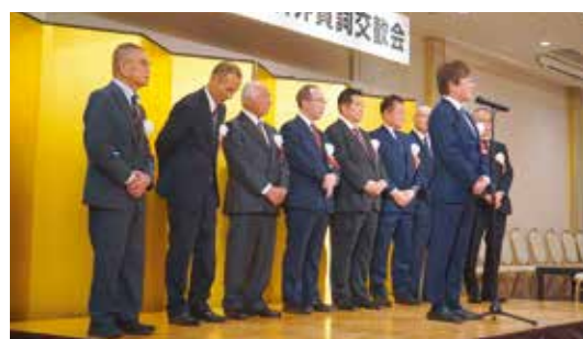
11 主催団体の皆さま