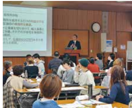
起業スクール様子

また、皆様の周囲で創業にご興味をお持ちの方がいらっしゃいましたら、ぜひ当商工会議所をご紹介いただけますと幸いです。