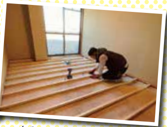
自分の手で再生していく様はこの仕事のやりがいです