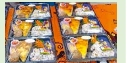
お弁当 (キッシュとブラジルミックス)