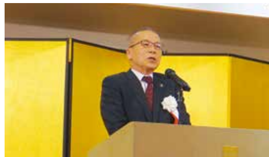
松戸徹船橋市長のご挨拶