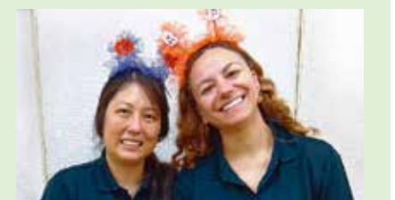
料理と接客は、 二人でやりくりしてます

当日は部屋の一角をハロウィンのオーナメントで飾り、お弁当やカップケーキ、スイートポテトなどを販売。オリーブの香り立つキッシュや素材の甘さを感じられるスイーツは大変好評の様子でした。次回は令和8年1月に出店される予定です。お近くへお越しの際は、ぜひお立ち寄りください。