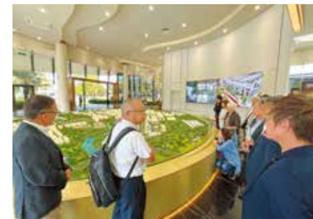
ベカメックス東急ギャラリー