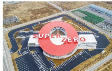
「浅野燃系(株)双葉事業所フタバスーパーゼロミル」