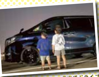
休日には息子たちを乗せて家族でドライブ