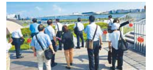
スカイデッキにて