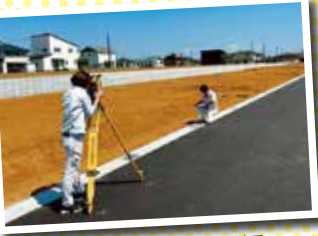
現場での測量・調査の様子

社名のリーフは、「白紙（ルーズリーフ）」を意味します。測量はゼロから図面を書いていくものなので、若々しい葉っぱのイメージと合わせて名付けました。会社は、設立から今日まで、年単位で決めた売上予定を、着実にこなしてきています。目標ではなく実行・遂行という表現が正しいかもしれません。一度決めたことはやりぬくべし、自分が置く環境がそうさせました。