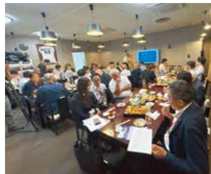
皆さん席を移動して交流されていました。