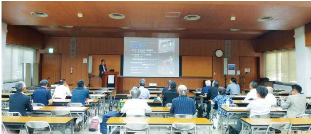
まちづくりの専門家 熊谷講師