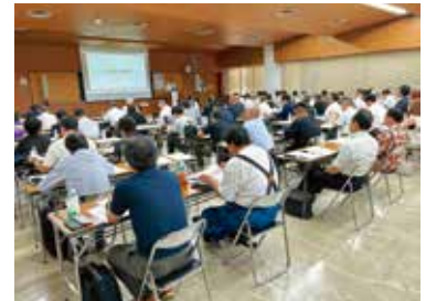
中小企業における動画活用術とは