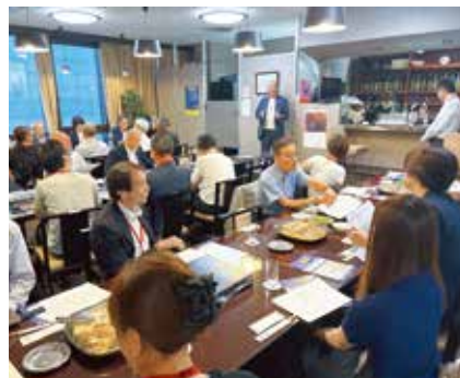
清水委員長挨拶 「カジュアルな体験機会としたい」