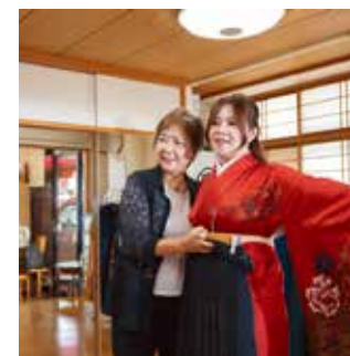
着付けサービスはお客様との会話も楽しめます

令和3年、地元のエビスきたなら商店会に入会し、副会長として「エビスきたなら祭り」を立ち上げました。祭りの開催・運営にあたり、船橋商工会議所の方々ともつながりをいただいたことをきっかけに、昨年会入しました。歴