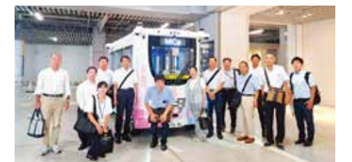
集合写真 自動運転バス「MiCa」前にて