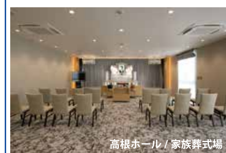
高根ホール / 家族葬式場