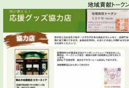
地域貢献トークンが使える 応援グッズ協力店の紹介