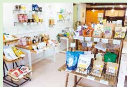
みかめ塗装店カラーストア 店舗の様子