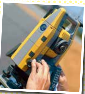
自動追尾機能を備えた測量機器