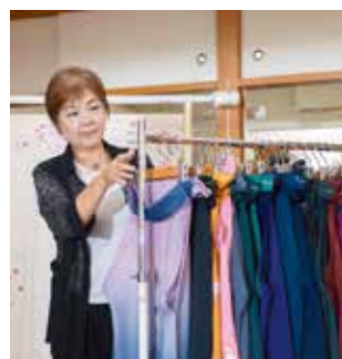
小学生から大学生、大人にも人気の袴レンタル

手がけ商標登録を受けることができました。このシリーズは市内だけでなく、東京や関東近郊の方にもご利用いただいています。また、振り袖をドレスとして着付ける名古屋発の「オリエンタル和装」の千葉県代理店として、新しい着物の活用と楽しみ方をご提案しています。