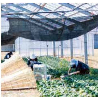
夏場は特に厳しいハウスの中で収穫作業

船橋という町は僕らのよう な一次産業に腰を据えて取り 組んでいる人がいて、その反 対側に船橋に来て、新しいビ ジネスを始める人たちがいま す。建物も古いものと新しい ものが調和しているのが面白 いですよね。だからこそ商売 も暮らしも一人勝ちを目指す のではなく、町も人も調和し ながら次の世代にこの船橋を 繋いでいきたいと思います。