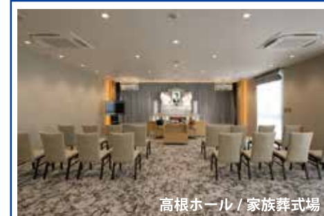
高根ホール / 家族葬式場