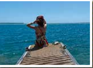
グアム旅行でリフレッシュ