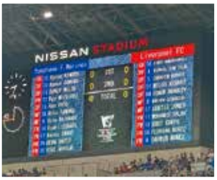
休日はサッカー観戦に出かけます