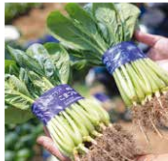
成長速度や茎の形など品種の異なる2種の小松菜

〈農業を続ける上で大切にし ていることをお聞かせくだ さい〉 どんなビジネスにおいても 欠かせない人脈を大事にして きました。それはひらの農園 の小松菜とそこから生まれた 「小松菜パウダー」が生んで くれたつながりです。小松菜 パウダーを生地に練り込んだ ピッツァ、生パスタ、中華麺 を手がけてくださった方々、 小松菜パウダーとホンビノス 貝を使った船橋バクダンコ ロッケでは、港の漁師さんと もつながりが出来ました。正 直なことをいえば、こうした つながりが生まれる前まで は、農業関係各所の慎重すぎ る対応に身動きが取りづら いと感じることも少なくあり ませんでした。美味しいもの を作っている自信はあるし、 応援してくれる方もたくさん いるのにと歯がゆく思うこと もあったので、認定を受け、 リスクも覚悟の上でチャレンジ 出来たことで多くのつながり を得られました。あくまでも うちは小松菜が入口。でもそ れがにんじんや梨など他の船 橋の農産物への興味につなが る機会もあるようです。もち ろんその逆も。こうして船橋 の六次産業化の一材料として