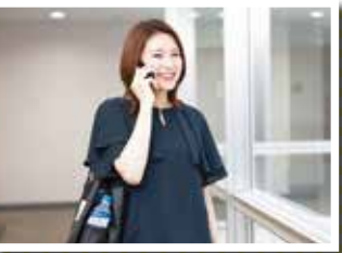
訪問前にお客様と電話でスケジュールを確認

現在、当社で力を入れているのが、プラズマ乳酸菌1,000億個配合の免疫ケアヨーグルトテイスト飲料「iMUSE」などのヘルスサイエンス分野です。お客様にキリンの商品を認識いただける場を増やし、もっと手軽に皆さまの健康意識を高めていただけるよう、飲料メーカーとしての努めを追求していきたいです。