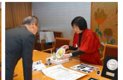
刺繍を披露するところ