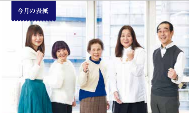
私たちは令和元年新入会員です!!!