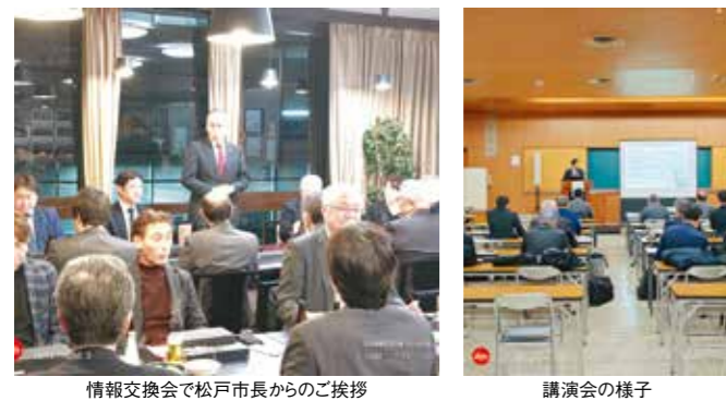
情報交換会で松戸市長からのご挨拶

スライド条項の適用が推奨されています。さらに、ウォーターPPPによる下水道事業の民間資源活用が紹介され、老朽化対策と財政健全化を目指す取り組みが強調されました。講義後の情報交換会においては、松戸市長にもご参加いただき参加者の皆様との貴重な意見交換の場になりました。 (相川)