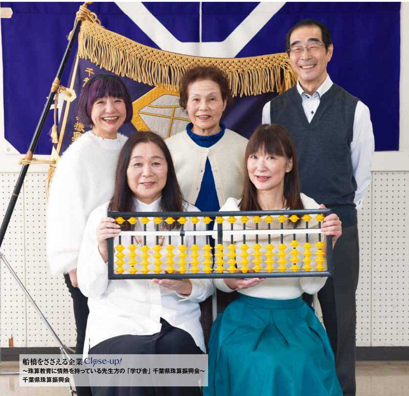
船橋をささえる企業 Close-up! ～珠算教育に情熱を持っている先生方の「学び舎」千葉県珠算振興会～ 千葉県珠算振興会

船橋商工会議所 令和6年度スローガン ～次世代の船橋商工会議所を見据えて考働する～