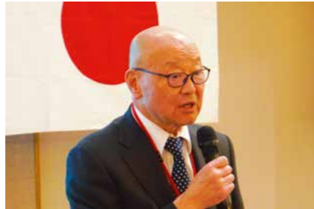
篠田会頭のご挨拶