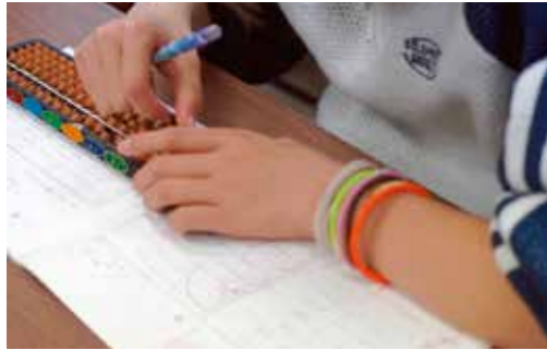
そろばんを通して右脳を育てます

皆さんはそろばんと聞いて何を思い浮かべますでしょうか?古くからある計算道具というイメージをお持ちの方も多いかもありません。しかし、そろばんは単なる計算道具にとどまらず、子どもたちの成長を大きく支える教育ツールでもあり、大人になってからも楽しめる生涯学習とも言われています。今回は、そろばんの普及と発展のために活動している団体、千葉県珠算振興会の皆さまにそろばんの魅力について伺いました。