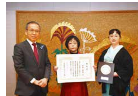
市長(左)、北井氏(中央)、桐谷氏(お弟子)(右)

当日は、受賞の喜びを市長へ報告するとともに、すばらしい作品や刺繍技術を披露いただきました。(商業振興課 山野)