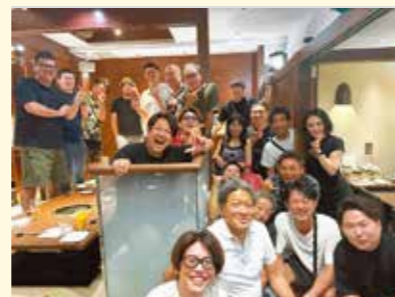
青年部では親睦を深める機会をご用意しています。