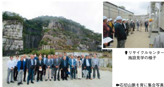
↑リサイクルセンター施設見学の様子

まっでできる「地図にない湖」を確認しました。リサイクルセンターでは、職員の方より施設の概要をご説明いただき、その後生ごみ等の処理を行うバイオプラント等の施設のご案内をいただきました。