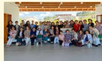
Bブロックの皆さん