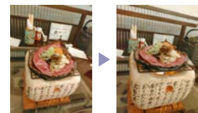
上から撮った写真