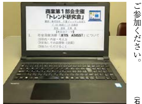
ご参加ください。(石月) お気軽にご参加ください

地元根差すチームとして地域社会に貢献し、地域を活性化させ、持続可能な社会を作ることを目指す事業です。