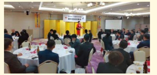
青年部では親睦を深める機会をご用意しています。(小石)

船橋商工会議所青年部の事業活性化のためにも是非多くの方々にご参加くださいますようお願い申し上げます。 (入会条件) 商工会議所会員又は、その後継者、事業責任者で満20才から50才までの方。 (会費) 年会費 3万6千円 ※但し、途中入会の方に関しては翌年3月までの月割りでの会費となります。 (問合せ先) 青年部事務局 小石 TEL 047-435-8211