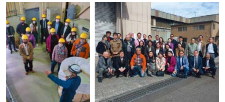
太陽光パネルの100%リサイクルを実現! 東扇島・川崎リサイクルセンター内で

とすると廃棄ピークは令和17年頃と想定され、今後稼働力の高い処理施設が必要となる旨を学びました。