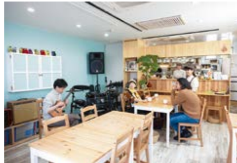
ゆったりとした空間でおつろぎください

経験しました。楽器店に来るお客様の中で、演奏する場や機会が減り、演奏する場所を探している人を多く見てきました。長く音楽に触れていたからこそ、演奏する楽しさや癒しを皆さんで共有したいと思っ、多くの方が楽器を持ち合わせて演奏をするイベントを企画しています。私自身は演奏をしなくても、皆が和気あいあいと演奏するのを見るのはほっこりします。飲食店を続けながらもイベントを開催し続ける理由はここにあります。〈読者に一言お願いします。〉遠方から足を運んでくださる方、「うたごえ喫茶」の頃から利用して下さっている方、皆さまに日々の感謝をお伝えしたいです。当店を利用してくださるお客