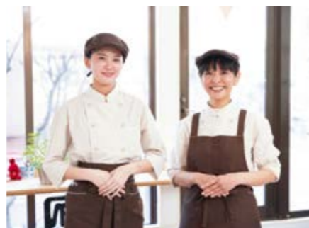
スタッフ一同、皆さまのご来店をお待ちしております

様が限る限り、「音 Cafe Ohana」は走り続けます。近くまで来た際は、ぜひ立ち寄りください。