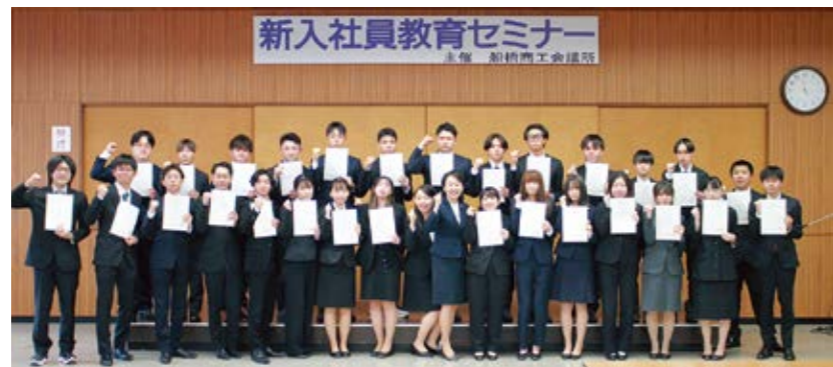
2日間の仲間と集合写真