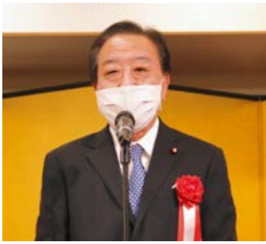
野田佳彦衆議院議員のご祝辞