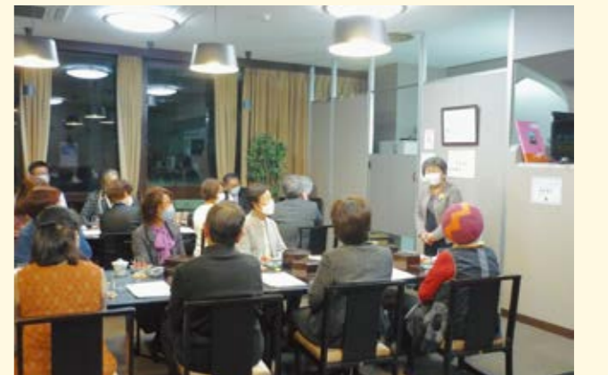
本会会長のご挨拶