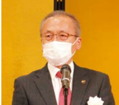
松戸徹 船橋市長のご挨拶