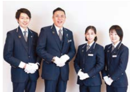
スタッフ一同お待ちしております