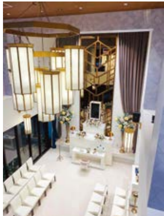
自社会館の「ここだけの家族葬ホールR」