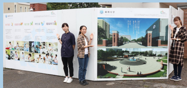
フィジビリティ調査時デモ掲出の様子