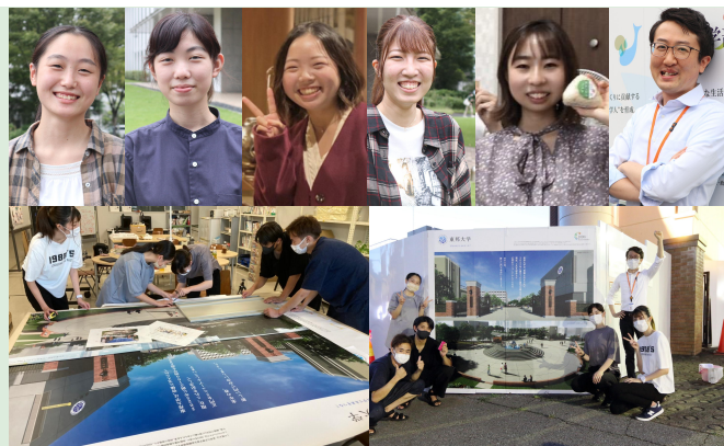
メンバーとフィジビリティ調査の様子

この事業は、地域の皆様へ持続可能な開発目標(SDGs)に関する身近な情報を提供することを目的に、SDGsに関する地域の様々な主体の取組事例を集約し、ウォールアートとして掲示することを目指しています。このウォールアートは、東邦大学習志野キャンパスで行われている正門工事の仮囲い壁を利用し、2022年5月の実施を予定しています。千葉エリアにおいてSDGsの地域的な取り組みが広がっていくことを目標としています。ウォールアートでSDGsの取組事例を紹介することでこの事業にご協力いただける地域のパートナー様を募集しています。