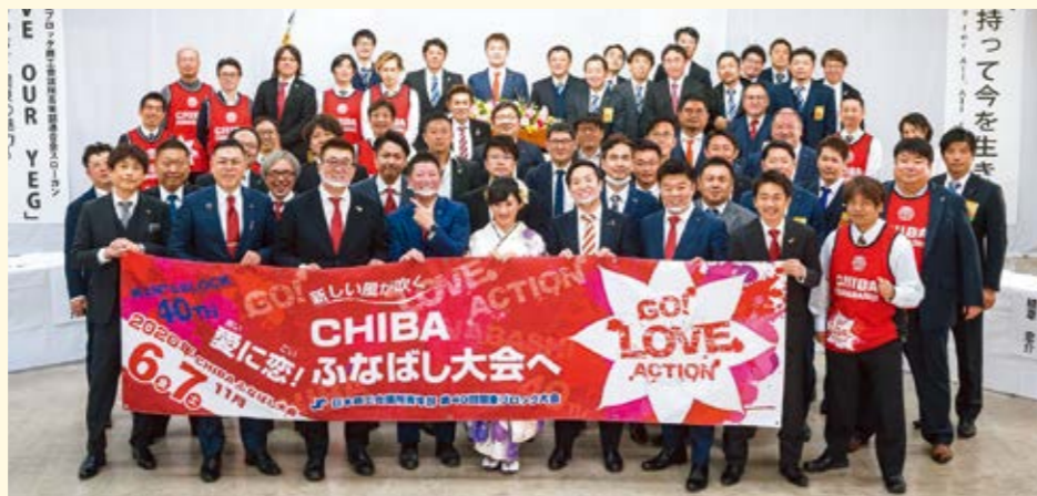
ふなばし大会やり切りました!