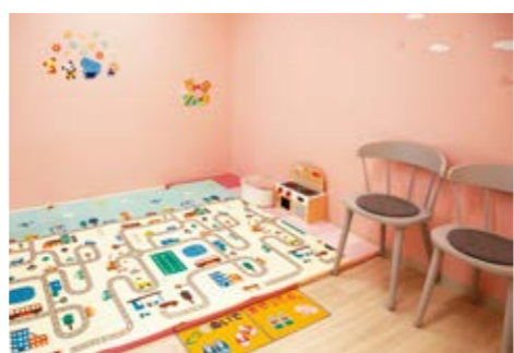
お子さまを連れてきて遊べるキッズスペース

診察時間は、平日10時から13時半と15時から19時、土日祝日は10時から13時と14時から17時。休診日は水曜日。