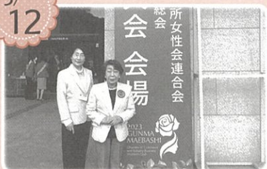
関東商工会議所女性会連合会 2023年度総会前橋大会