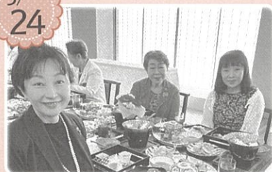
千葉県商工会議所女性会連合会 通常総会東金大会