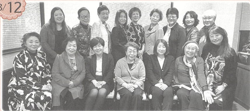
ウーマンビジネス交流会