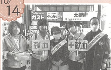
ふなばし市民まつり街頭献血 啓発活動に参加しました