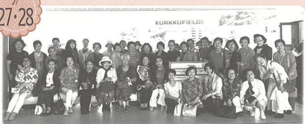
2023年度広域ブロック活動事業