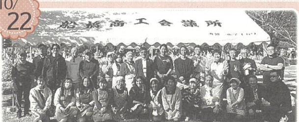
インターナショナルフェスティバル2023に参加