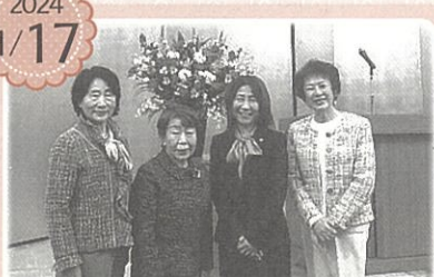
賀詞交歓会参加者 三井ガーデンホテル千葉