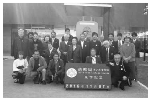
造幣局さいたま支局にて