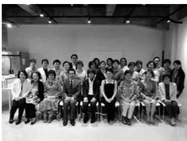
～6月総会のミニコンサート～

会員の方々には、事業毎に参加集を行っております。女性会にご入会頂き、一緒に事業に参加してみませんか!