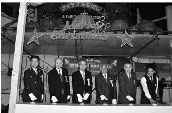
イルミネーション点灯式の様子