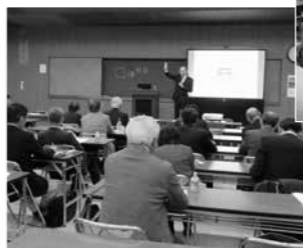
熱気あふれる会場