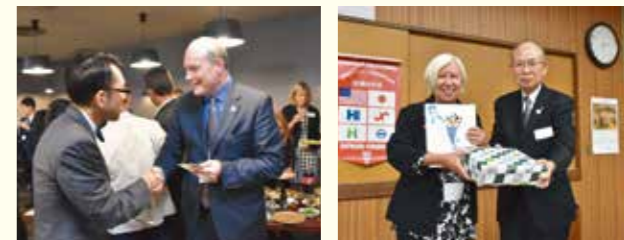
～深まる交流の様子～

平成28年11月7日に船橋市・ハイワード市「姉妹都市」提携30周年及び平成29年船橋商工会議所・ハイワード商業会議所「友好の証」提携30周年を機に経済交流を深めるため10月24日(月)ハイワード商工会議所との経済フォーラムを開催しました。