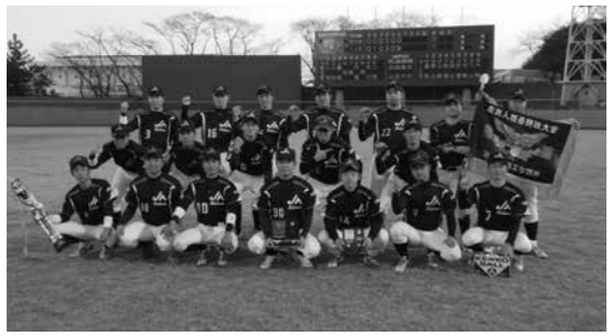
初出場・初優勝を飾ったJAいちかわ