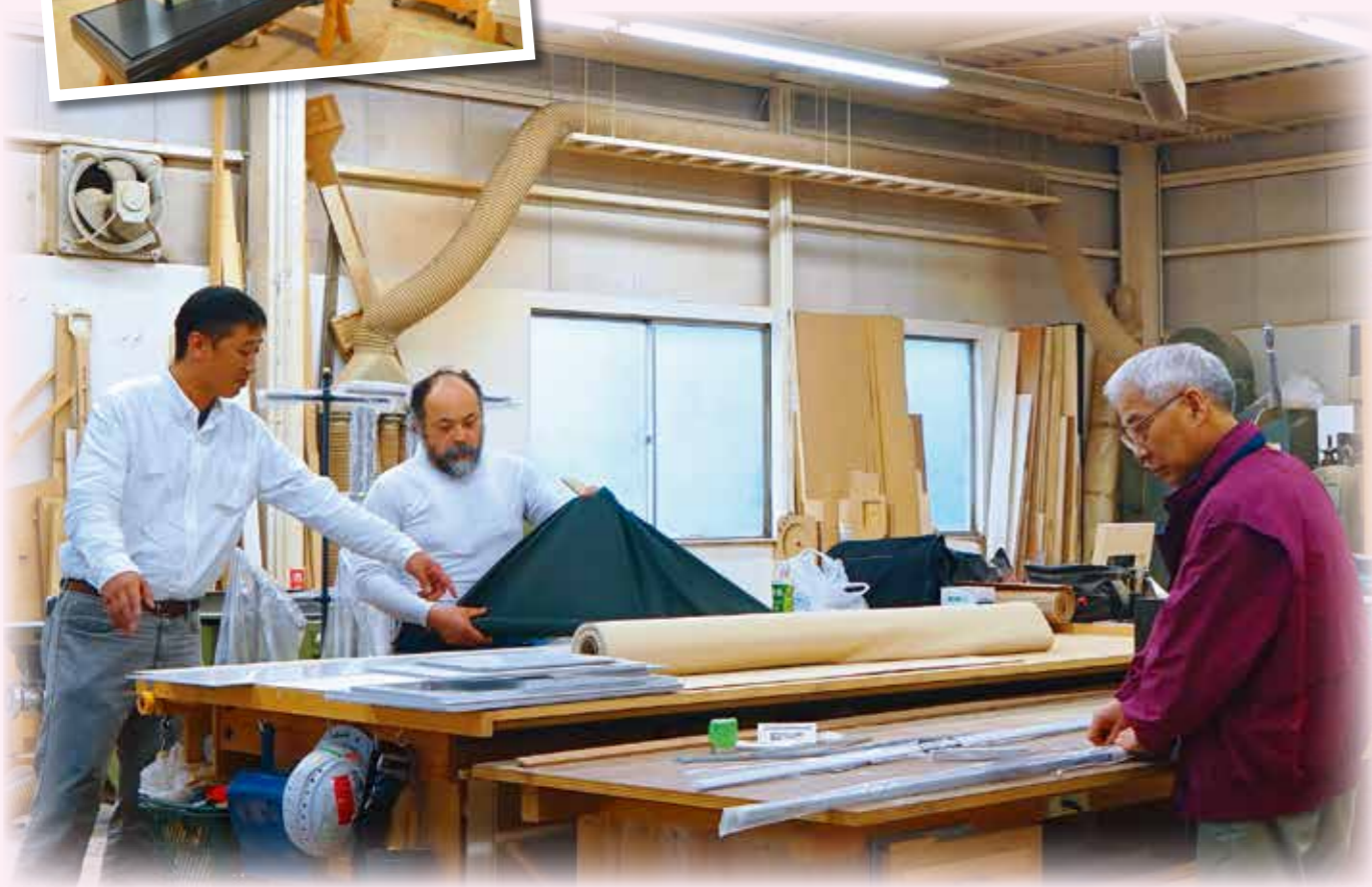
株式会社メッセ ディスプレイ製作の様子