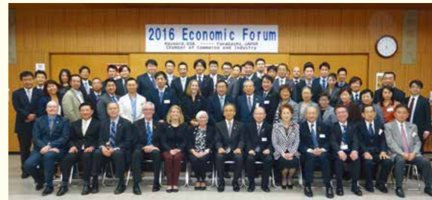
～友交の証！記念撮影～

当日は80名もの参加者の元、ハイワード市・ハイワード商工会議所や船橋商工会議所の活動についてプレゼンテーションを行い、それぞれの産品を展示及び試食を行いながら、今後の経済交流について意見交換を行いました。