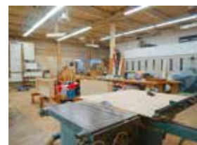
どんな要望にも迅速に対応します。

オープンを迎えるお客様にとって最高のスタートを切っていただきたい。 そのために私たちは全力でお手伝いします。