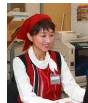
スケジュール管理も笑顔で!!

職場環境はいいですが、出産後、時短勤務を利用し職場復帰を果たしました。子育て中の女性に理解がある素晴らしい職場です。若い世代が仕事と子育てを両立する手本となるようにがんばりたいです。