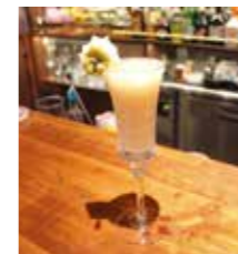
ラ・フランスとジュニパーベリーとシャンパンのカクテル

2015年5月「船橋をBarの街にしたい」と京成船橋駅前に開店。おススメは季節の旬のフルーツを使ったカクテル。12月はシャンパンをベースにザクロやラ・フランスのカクテルが魅惑の夜を彩ってくれる。「非日常を味わいながら、ゆっくりお酒を楽しむ時間があってもいいじゃないですか、そんな良いお酒の文化を広めたい」と語る。