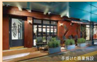
手掛けた商業施設