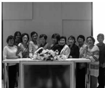
大好評のお誕生日会