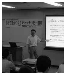
よいキャッチコピーを書くために

「キャッチコピーの選び方」などを説明いただきました。セミナー終了後も講師に質問される参加者が多く有意義なセミナーとなりました。