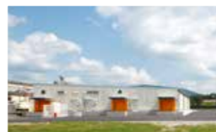
食物アレルギー配慮施設