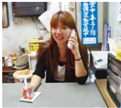
お客様に喜んで頂けるように...

新しいことが大好き。ハードルは高ければ高い程燃えます。ゼロからの海外輸出事業を軌道に導いてくれた立役者ですね。そして緻密な経理処理には助けられています。