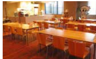
本社1階にてランチを提供中