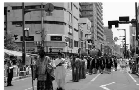
天狗様を先頭に御輿行列