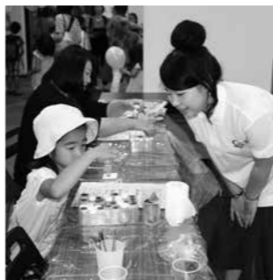
日本大学理工学部による七宝焼きをつくろう!

会2015」、船橋商工会議所異業種交流会プラザ2001による「万華鏡作り!」「ペーパークラフト」などが人気を集めました。25日(土) ジョイ&ショッピングでは、市内団体を中心とした約200のフリーマーケットが出店し、ストリートダンスや和太鼓の演奏、演武等がイベントを盛り上げました。26日(日) ふれあいまつりは、華やかなオープニングパレードから始まり、勇壮な神輿、民踊パレード、ばか面踊り等が繰り広げられ、市内各会場の参加者総計は、38万4千人となりました。29日(水)、「船橋港親水花火大会」へは、