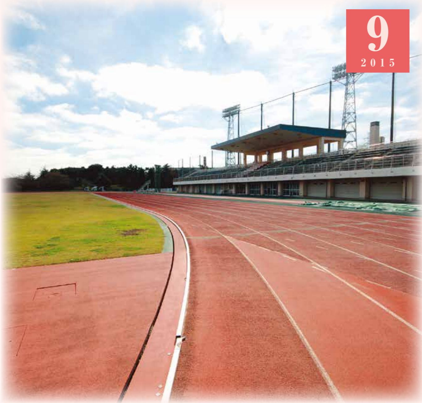
船橋運動公園陸上競技場