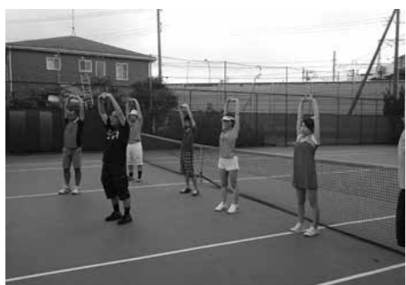
練習前の準備体操

テニス経験がない方も多く、和気藹々と皆さん楽しんでおりました。一通りの練習後には委員会対抗の試合を行い、チーム