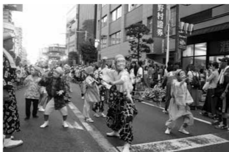
船橋郷土芸能 ばか面踊り

約8万人の見物客が詰めかけ、約8,500発の花火に酔いしれました。船橋の暑い夏の風物詩です。