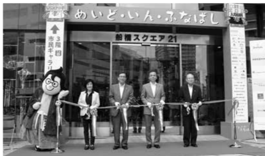
「めいど・いん・ふなばし」 テープカットの瞬間

7月24日(金)、船橋スクエア21市民ギャラリー前で、テープカットや消防音楽隊による演奏等のオープニングセレモニーを皮切りに、「めいど・いん・ふなばし」がスタート。船橋の工業の素晴らしさを伝えようと製品や企業紹介のパネル展示が行われました。会場では、つくるよるこび・たのしさを子どもたち伝えようで行われた、日本大学理工学部による「はかせくんとエンジニア体験