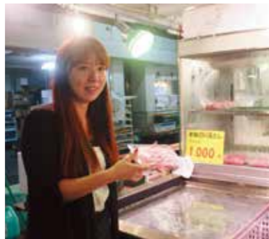
新鮮なマグロ是非おためし下さい!

「船橋の市場で父がマグロの競り人をしてきたことがきっかけでこの職業に就きました」と語る岡部さんに今月はインタビューをしてきました。