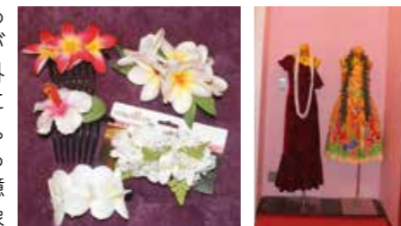
大人可愛いヘアクリップ 着る方を彩る華やかな衣装

「インターネットは、言語と通貨と配送の3つが揃えば、世界中で商売ができる」と岸社長。日本国内だけでも十分にメリットはあるが、世界中の人がアクセスする海外のほうがはるかにメリットが大きい。英語圏であつたらいつに何十億人のお客様を対象に商売ができる。