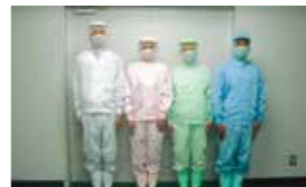
食品の混入を防ぐ衣服の色分け

船橋市と「災害時における帰宅困難者支援に関する協定」を結び、火や水がなくても食べられる非常食の開発にも取り組んだ。創業当時から一貫していることは、お客様の食での「お困りごと」。「あったらいいな」の声にこたえる商品開発をしていることだ。石井食品(株)の消費者を想う心は、母の愛そのものだ。