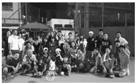
ステキな笑顔で集合写真

はなぶさが優勝いたしました。優勝したチームははなぶさには商品として旬のフルーツ詰め合わせが送られました。テニスと並行してBBQも開催し、テニスをしてお腹がすいた参加者は炭火で焼いたお肉を頬張っております。