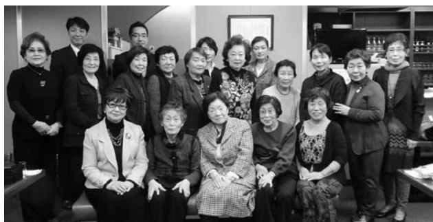
出席者皆様で記念写真パチリ!!

そして、交換したプレゼントを手には、今年の出来事・近況報告など、皆様に一言ずつ自己紹介をまじえ話していただきました。