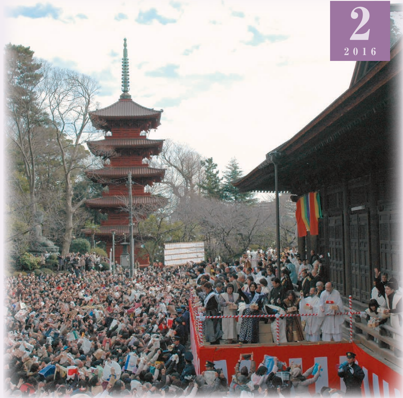
中山法華経寺の節分会