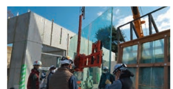
強固な熊舎のガラスを施工中