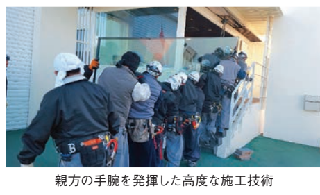
親方の手腕を発揮した高度な施工技術

一枚のガラスに込められた高度な技術 一枚のガラスかもしれないが、そこに込められる技術は素晴らしい。注文が増え続けている防犯ガラス。同社では厚さ3ミリのガラス2枚の間に厚いフィルムを挿入し、高温で焼きつけ圧着する。住宅メーカーの実験によると、このガラスを破って侵入するのにかかった時間は約40分。大半の泥棒が5分以上かかる場合あきらめるといわれ、同社の防犯ガラスがいかに有効であるかがわかる。夏は涼しく、冬はあたたかく過ごしたいという願いを叶えてくれるのが、LOW-Eガラス。放射による伝熱を少なくする性質を持ち、夏の強い日差しを50%以上カットする。冬は逆に室内の熱を逃がさないの、暖かいまま過ごすことができる。冷暖房によるCO2削減が叫ばれている中、画期的な製品だ。一枚のガラスには、人や地球環境を守る多様な可能性が秘められている。