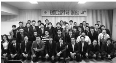
総会での集合写真

その後「ふなばし稲荷屋」に会場を移して忘年会を開催し、次年度の話を中心に懇親を深めました。