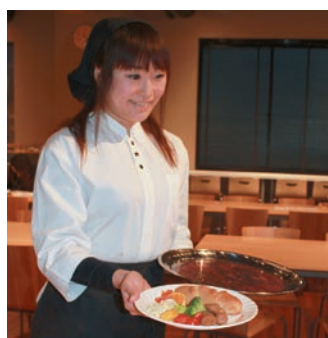
お食事も楽しめます!

他社にはない、御社ならではのサービスは何ですか? ご来店をいただいた際に、商品の特徴やアレンジメニューの仕方などのご提案をしております。また、直売店で購入した商品をお店でお召し上がりいただけます。