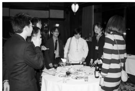
フリータイムの様子

最後は、お互いに気になる異性の名前をアタックカードに記入し、カップルを発表。今回誕生したカップルは8組!高橋委員長よりお祝いの言葉と共に、カップル賞を一組一組に手渡しして頂きました。次回は、皆様のご参加お待ちしております!