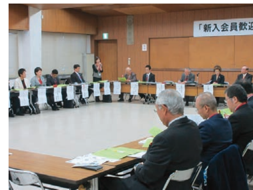
お互いの事業を知り合う絶好のチャンス！

金など）申請支援のコンサルタントにおいて、本年度実績64,409,802円を獲得いたしました。「お金なし、コネなしでも取材殺到！元テレビマシンの活用による売上アップの極意を伝授します。」など、各社の魅力が次々と伝えられました。