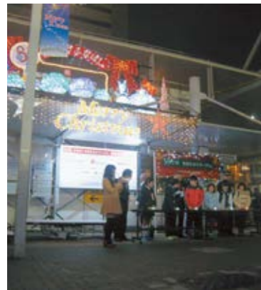
イルミネーション点灯式の様子

11月18日(土)JR船橋駅南口交番前で、「アイラブふなばし実行委員会」主催によるイルミネーション点灯式が行われました。今年、イルミネーションの他、フォトコンテストも開催いたします。イルミネーションは、来年の1月31日まで点灯。フォトコンテストは12月31日まで実施します。 ※アイラブふなばし実行委員会 船橋駅周辺の複数商店会と企業が連携し、駅周辺の商業環境整備、船橋商業の発展を目的とした団体。(河野)