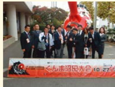
関東ブロック大会集合写真

今回は初めて事業として関東ブロック大会に参加するという事で不慣れな点多々ありましたが、無事2日間終える事が出来ました。当日ご参加頂いた会員・関係者の皆様、誠にありがとうございました。来年度は今年以上に多くの方々にご参加頂き関東ブロック大会の勉強をしていく中で交流と連携を深めて船橋や自企業の発展につなげて頂ければと思います。