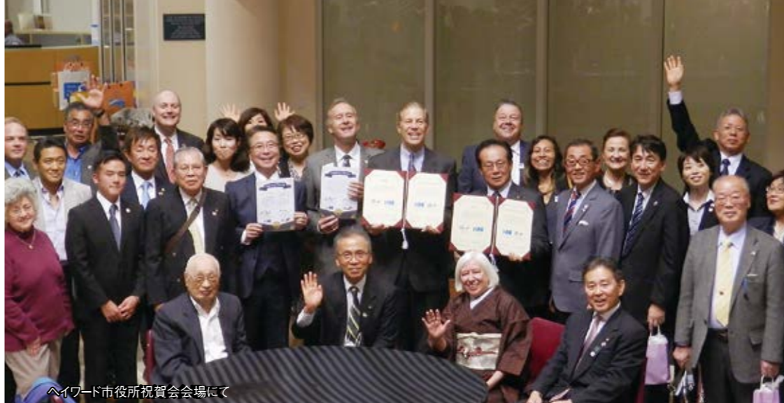
ヘイワード市役所祝賀会会場にて