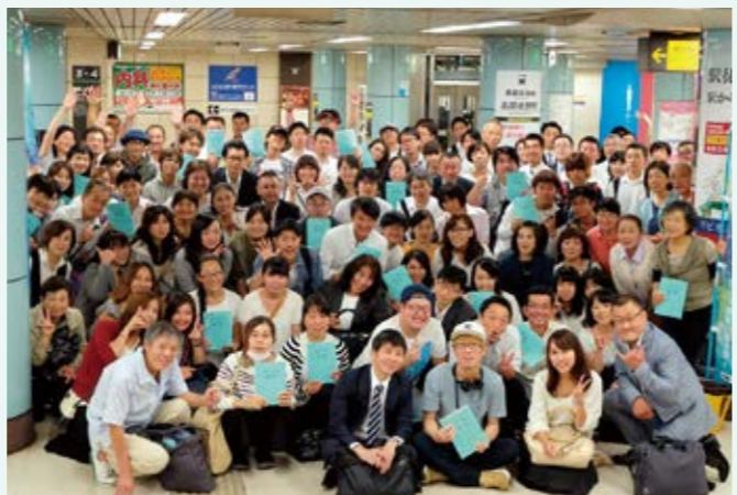
▲市民エキストラのみなさま

改めまして惜しみないご協力とご協賛、ご支援をいただいた個人様、法人様、団体様に厚く御礼申し上げますとともに、