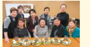
女性会クリスマスアレンジメント

今回は女性会でも初めての試みでしたので、初心者でも2時間程度で作製できるデザインを考えていただきました。キャンドルを添えてクリスマスの飾りに香りを足してお部屋のインテリアの一部としてなどアレンジ可能で、参加者それぞれの個性を生かした作品が出来上がりました。(楡山)