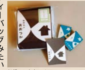
船橋のお土産にぜひ!

化します。おつかでは、豆本来の旨みや香りを引き出す焙煎方法を推奨しますが、お客様の好みに合わせて、苦味が苦手なお客様には深煎りではなく浅煎りにするなど、オーダーメイドで提供できるところが量販店にはない魅力です。 千葉工業大学とのコラボ商品 「クイックコーヒーバッグ」 お客様より、出先や職場でインスタントでは、美味しい、美味しくないコーヒーが飲みたい!と相談を受け、クイックコーヒーバッグを作り出しました。ティーバッグみたいにコーヒーを抽出できるものです。ラッピングのデザインを千葉工業大学デザイン科の学生さんが作成しました。金物屋の時代にお配りしていたマッチ箱の柄をリニューアルし、外国人のお客様にも伝わる様、絵で使用方法がわかるようにしてもらいました。ご当地ブレンドコーヒー、津田沼・習志野・船橋の3種類を使用した珈琲バッグセット「よりどり」がおすすめです。船橋のこだわった手土産にどうぞ!