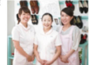
スタッフの皆さま