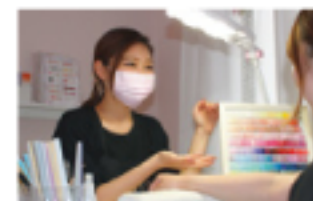
指先が美しく見えるモテネイル

ラッシュの最新技術にチャレンジしています。地まつげを1回あげてから、アイラッシュをつけるので、カールが下がらず輝く瞳を演出します。お客様に喜んでいただけるように、がんばります。