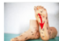
土踏まずを刺激しましょう

腸を元気にして! 夏の疲れ知らず 土踏まずあたりに猫の手にした第2指関節を使ってつま先からかかとに向かって刺激しましょう。