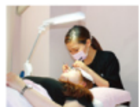
確かな技術でやりたいものに