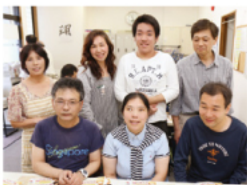
スタッフのみなさん

ば……。」という気持ちになっ ていました。ところが今では、私の方 が教わり、気付けて貰っており ます。 関わった以上に努力され、成長 されていく姿に、元気をいただき 励まされています。 いつか「障がい者雇用」という 言葉自体が無くなり、健常者と障 害のある方の垣根がなくなるこ とを強く願っています。