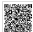
QRコード 【フットケア】