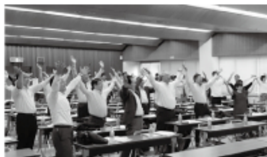
笑いヨガ 実践風景