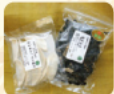
わかめたっぷり餃子/ 絆わかめ

石巻十三浜産わかめをたっぷり使い、化学調味料無添加でにんにく不使用のヘルシーな餃子です。千葉県産もち豚を国産小麦のモチモチとした皮でくるみ、ひとつひとつ心を込めて手作りしています。