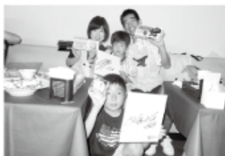
サイン入りグッズを出て喜ぶ会員家族

スイーツを青年部で貸切とし観戦しました。観戦の途中には選手のサイン入りグッズなどがあたる抽選会も開催され、盛り上がりました。今回の事業は会員家族も参加され、改めて青年部活動にご理解頂ける場になりました。