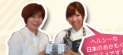
ヘルシーな 日本のあかもく おすすめ!